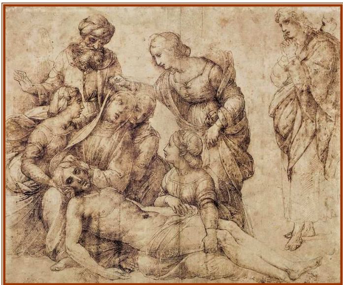
RAFFAELLO SANZIO (1483 - 1520) Studio per la Pala Baglioni , (1507)